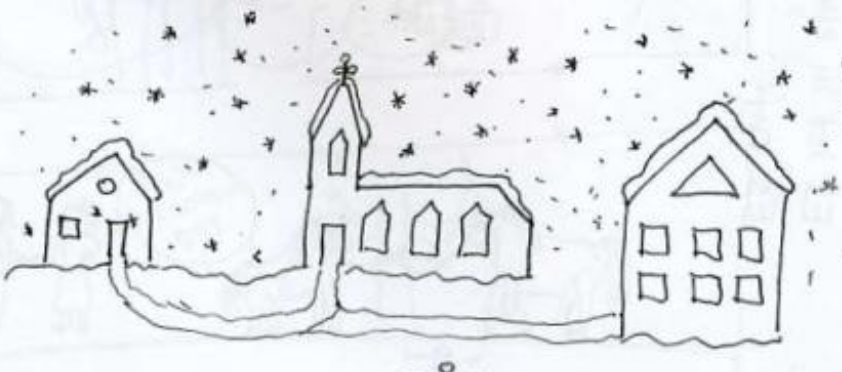
von Ricarda (mittlerweile 9. Klasse)