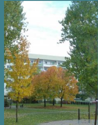
Der Herbst ist da!