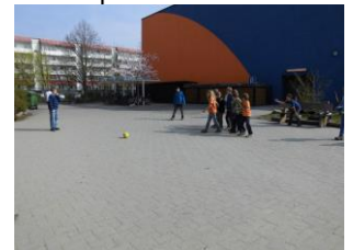
Fußball dieses Jahr