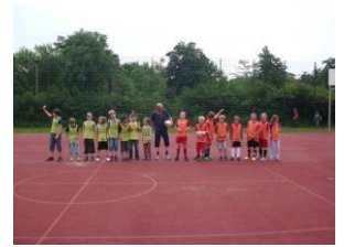
Flurpokal letztes Jahr