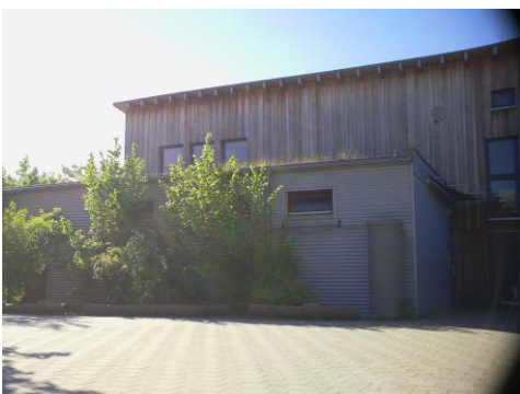
der Hort von außen