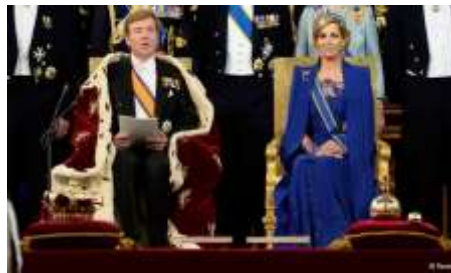
Jetzt König: Willem-Alexander und Königin Maxima